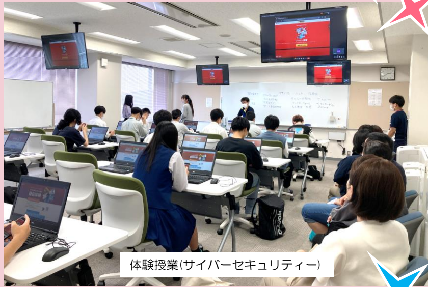
体験授業(サイバーセキュリティ)