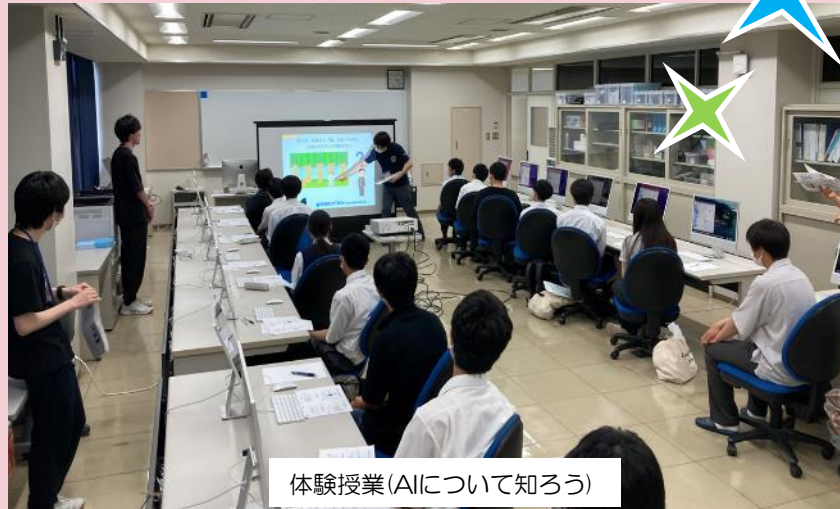
体験授業(AIについて知ろう)