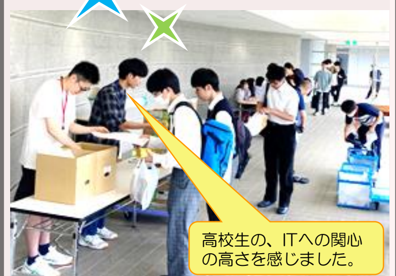
高校生の、ITへの関心の高さを感じました。