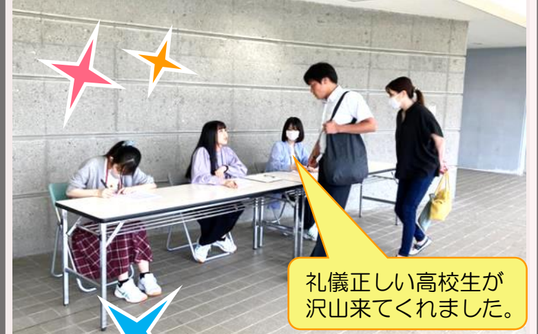
礼儀正しい高校生が沢山来てくれました。

8人の学生が「第1回オープンキャンパス」をサポートしました。受付から体験授業をサポートした写真とコメントをご紹介します。