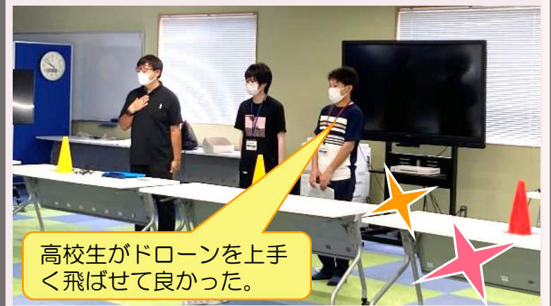
高校生がドローンを上手く飛ばせて良かった。