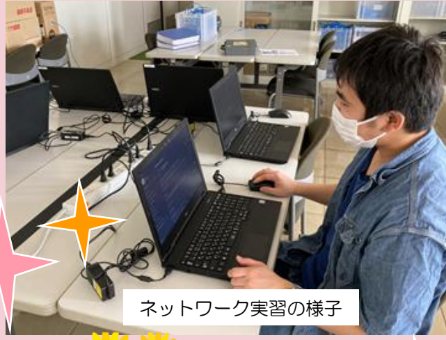
ネットワーク実習の様子