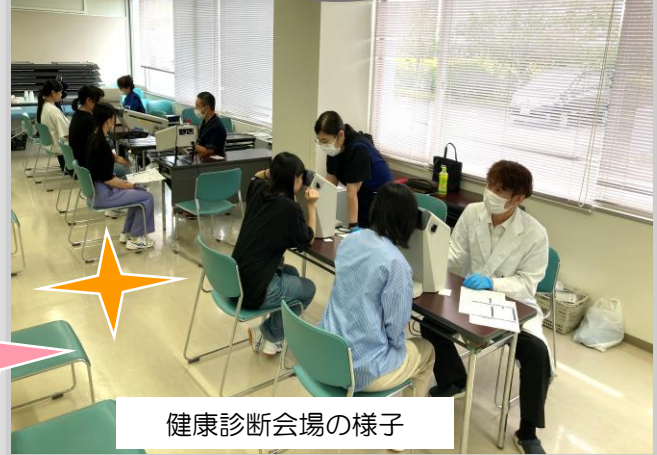
健康診断会場の様子