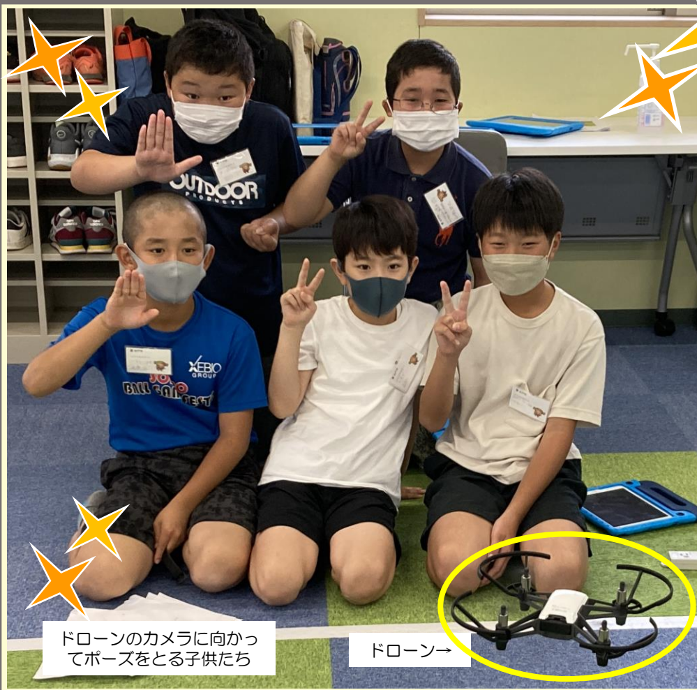
ドローンのカメラに向かってポーズをとる子供たち