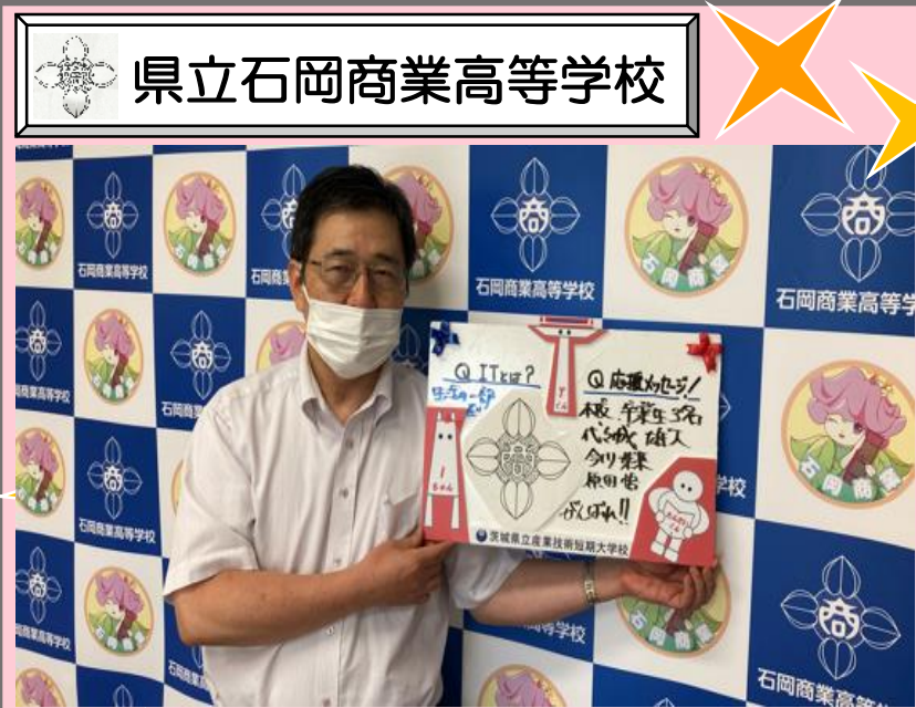
県立石岡商業高等学校