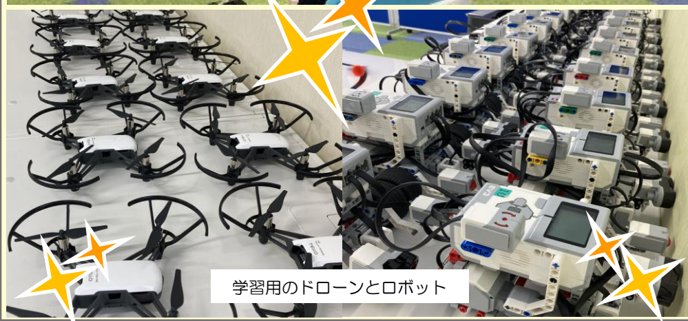
学習用のドローンとロボット